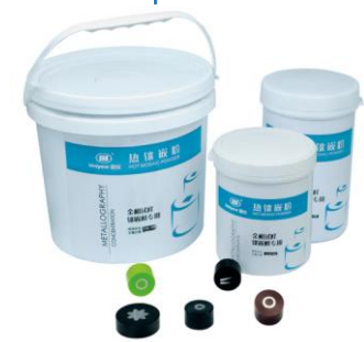
Бакелит для горячей запрессовки