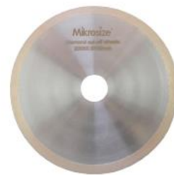
Алмазные отрезные диски